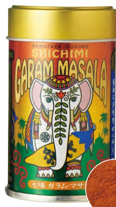
老舗の伝統技術で作る 香り豊かなスパイス。

セロリが芳醇に香るシーズニング。塩の代わりにさっと振れば、ぐっと香り豊かで味わい深く仕上がります。魚料理はもちろん、トマトとも相性抜群。ブイヤベースなど、魚介×トマトの料理におすすめです。"マスコット セロリソルト"356円(ヤスマ)