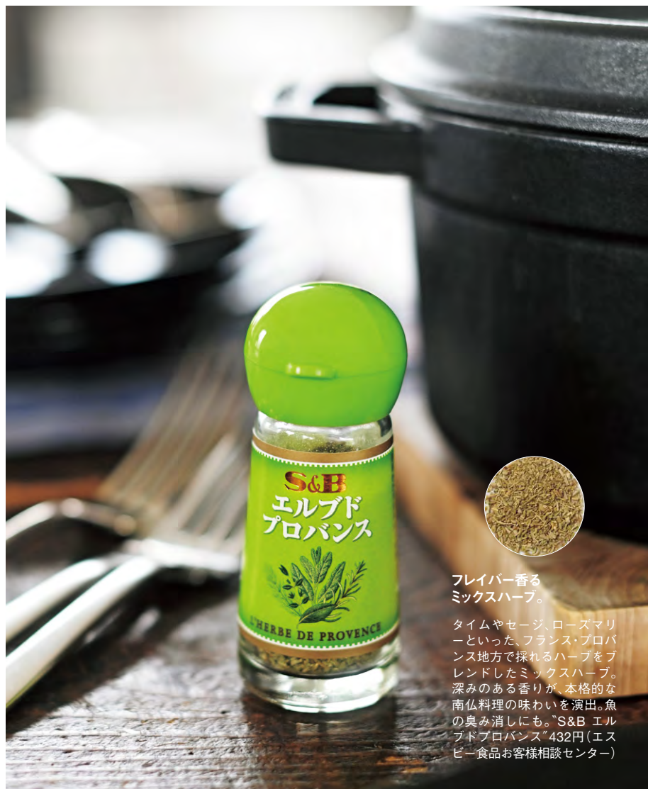
フレイバー香る ミックスハーブ。

タイムやセージ、ローズマリーといった、フランス・プロバンス地方で採れるハーブをブレンドしたミックスハーブ。深みのある香りが、本格的な南仏料理の味わいを演出。魚の臭み消しにも。"S&B エルブドプロバンス"432円(エスピー食品お客様相談センター)