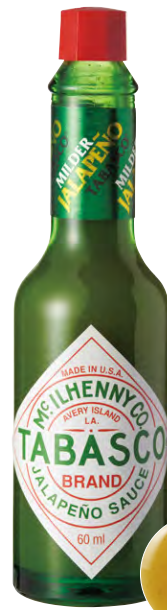
シーフードの旨味が 辛味と酸味で引き立つ。

日本三大七味のひとつと謳われる信州の八幡屋礒五郎。その老舗がガラムマサラをまさかのプロデュース。伝統の焙煎技術を生かした香り豊かなスパイスが、いつもの魚料理をスパイシーに彩ります。"八幡屋礒五郎 七味ガラム・マサラ"540円(八幡屋礒五郎)