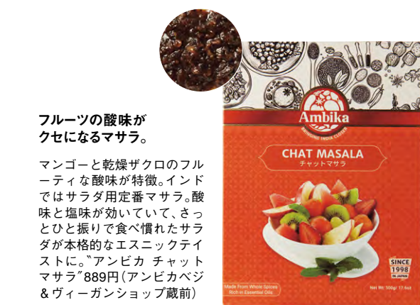
フルーツの酸味が クセになるマサラ。

独特の辛味と酸味が魅力のタバスコ。こちらの"緑のタバスコ"は、お馴染みの"赤のタバスコ"に比べて辛味が控えめで、青唐辛子ならではのフルーティな味わい。だから、クセのある魚介にぴったり。"タバスコ ハラペニョソース"302円(正田醤油)