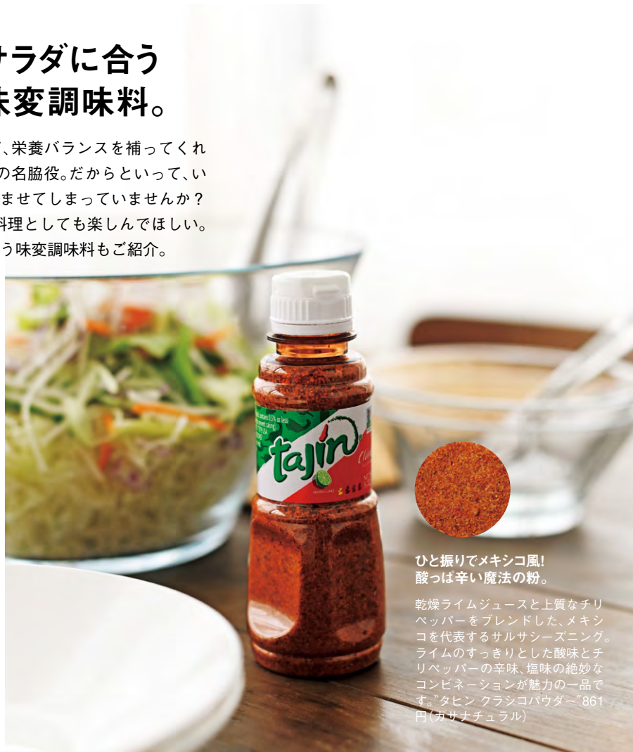
ひと振りでメキシコ風！ 酸っぱい魔法の粉。

ザアタルと呼ばれるタイム系のハーブに、ゴマや塩、オリーブオイルなどをブレンドしたマイルドな味わいの万能ハーブ調味料。パレスチナでは、オリーブオイルとともにパンにつけていただくのが定番。サラダにも◎です。"ザアタル(ハーブミックス)"957円(ザハラ)