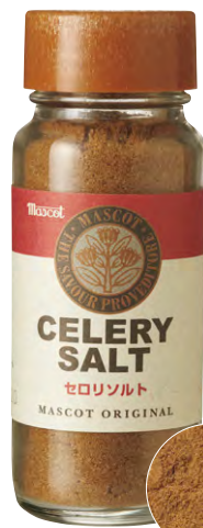
香りとほろ苦さが 魚料理を引き立てる。

秋刀魚や鮭、鯖など、旬の魚がぐっと増える秋。これからの季節、食卓に上がる機会も多いでしょう。しかし、魚ごとの料理のバリエーションというのは意外と少ないもの。いつもの魚料理ががらりと表情を変える、イチオシの味変調味料を揃えました。