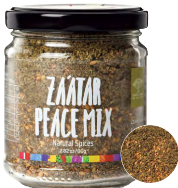
日本人の舌にも合う中東ミックスハーブ。

フリーズドライした醤油にフライドガーリックやオニオンを合わせた、新感覚の"食べるしょうゆ"。旨味と香ばしさ、独特の食感がやみつきに。深みのある味わいがサラダをプロの味に。"キッコーマン サクサクしょうゆ"346円(キッコーマンお客様相談センター)