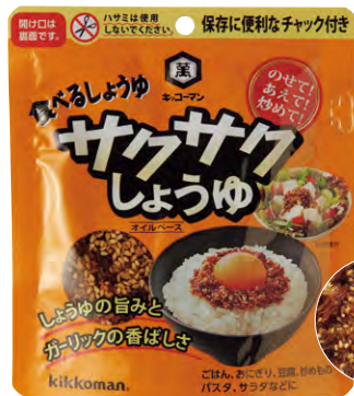
サクサク感がクセになる"食べる醤油"。

メイン料理を引き立て、栄養バランスを補ってくれるサラダ。まさに食卓の名脇役。だからといって、いつもドレッシングで済ませてしまっていないですか？せっかくなら、メイン料理としても楽しんでほしい。ということで野菜に合う味変調味料もご紹介。