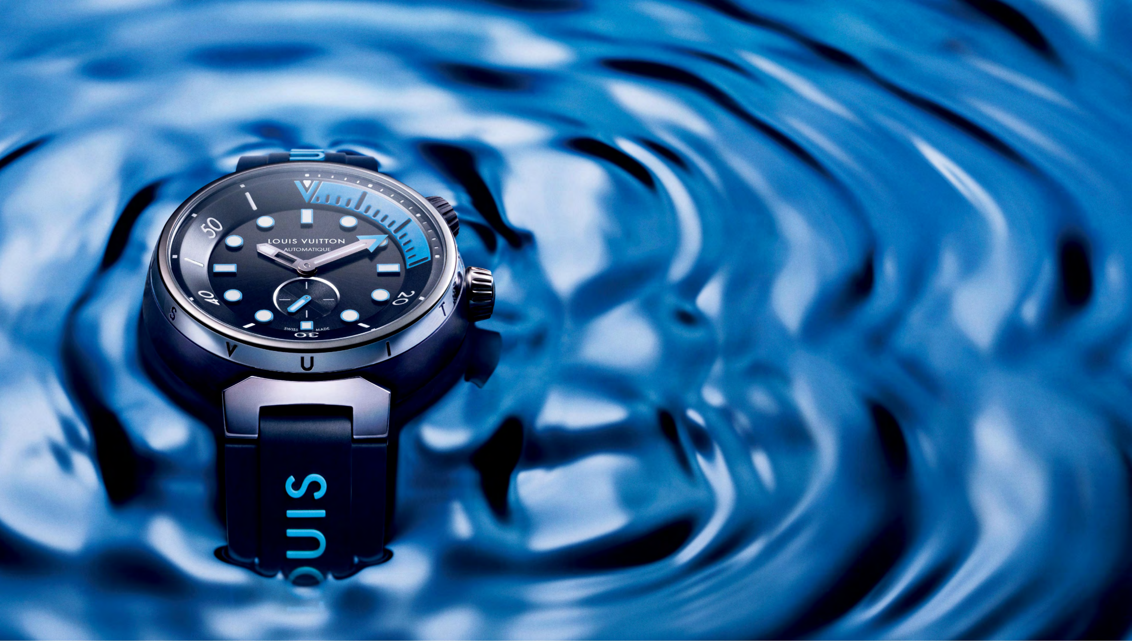
TAMBOUR STREET DIVER