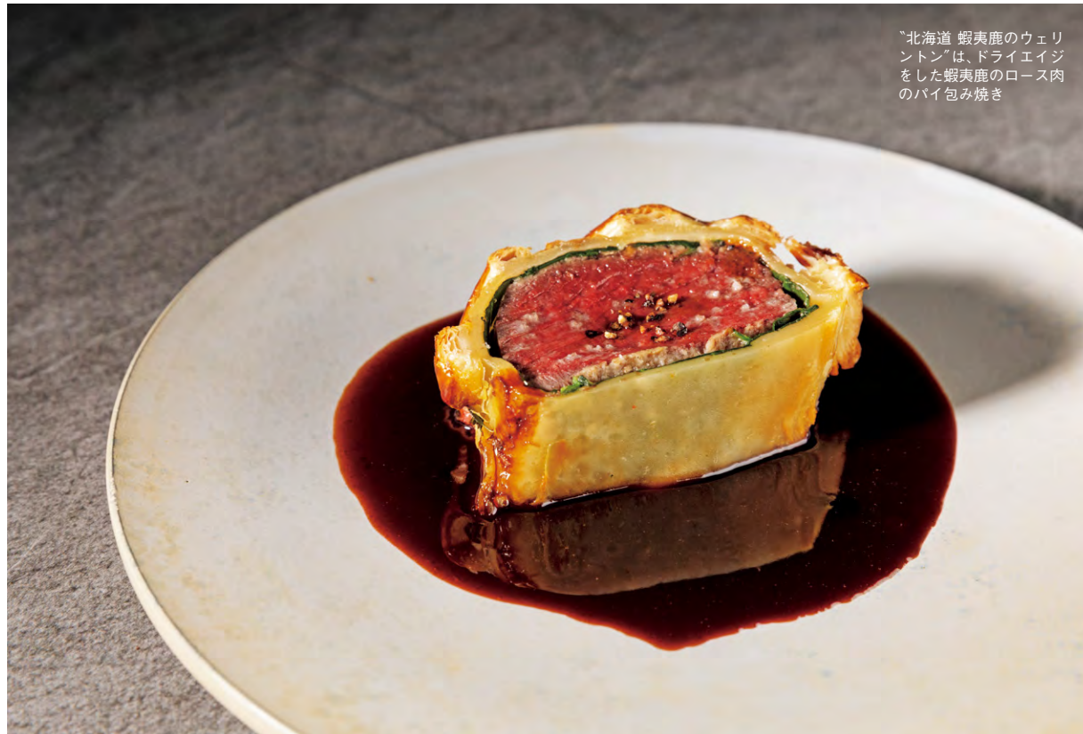
“北海道 蝦夷鹿のウェリントン”は、ドライエイジをした蝦夷鹿のロース肉のバイ包み焼き

1964年神奈川県山梨生まれ。ファッションからカルチャー、美食などをテーマに新聞や雑誌、テレビで活動中。主な著書に『名店レシピの巡礼修業』(世界文化社)がある。2013年より『世界ベストレストラン50』の日本評議委員長も務める。'22年春より、JR九州が運行する「なつつ星in九州」の車内誌の編集長に就任。