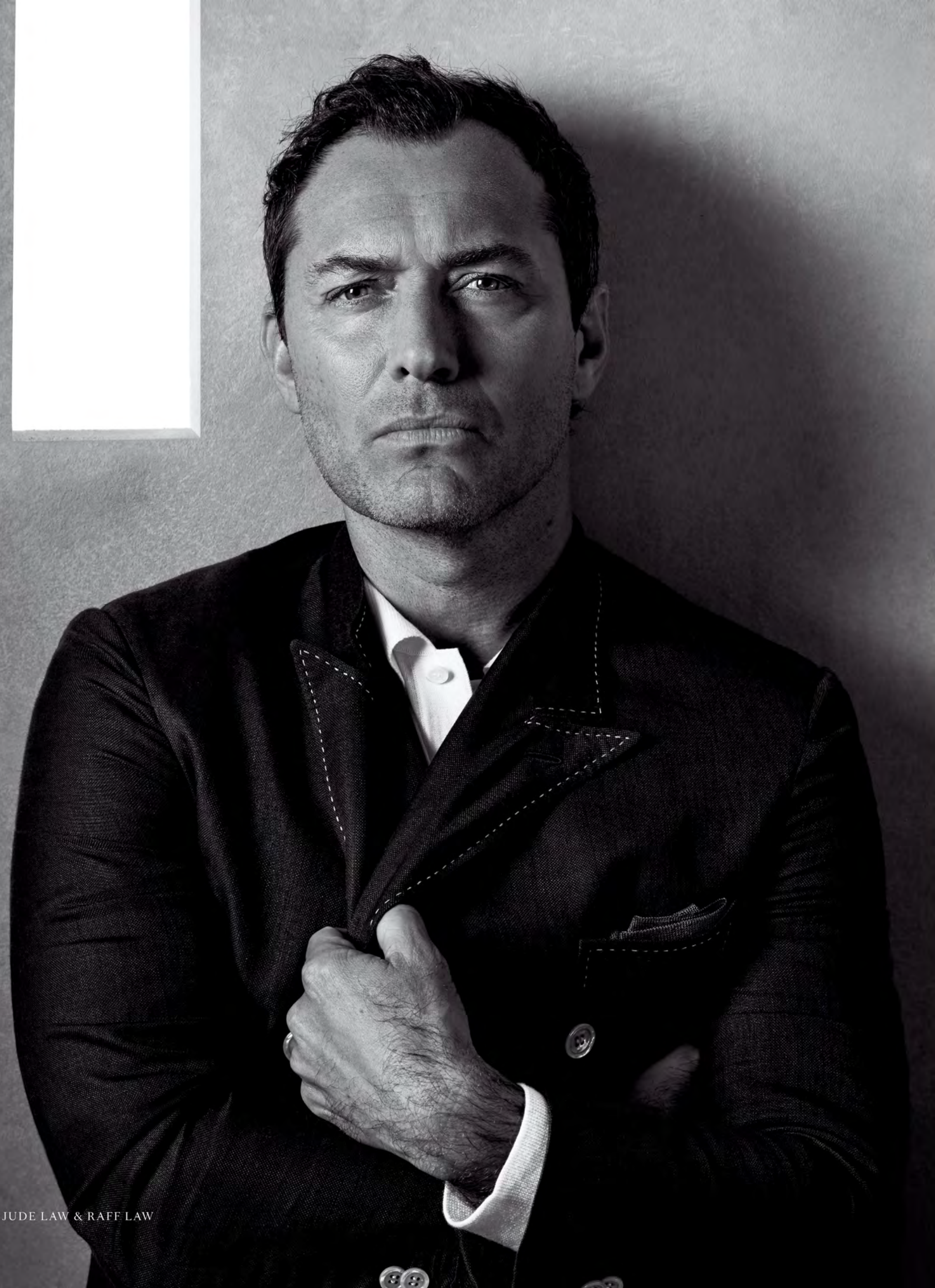
JUDE LAW & RAFF LAW