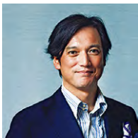
取材・文 中村孝則 美食評論家

従来の固定概念に固執せず、自由な発想やスタイルに挑んでいる和食のニューウェイブ。外食の醍醐味や歓びを再認識するうえでも訪れたい2店である。