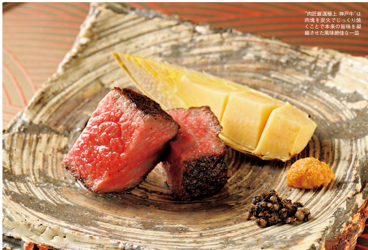
“肉匠厳選極上 神戸牛”は肉塊を炭火でじっくり焼くことで本来の旨味を凝縮させた風味絶佳な一皿