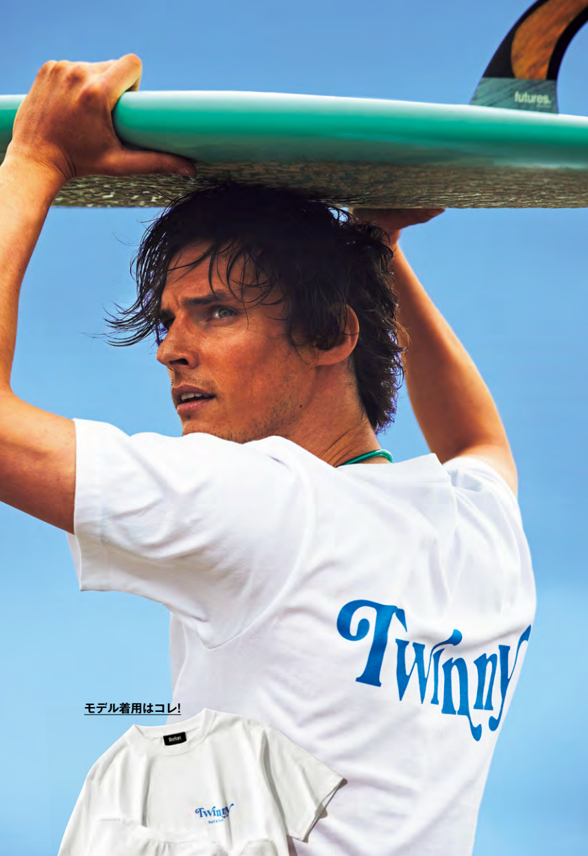
モデル着用はコレ!