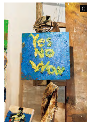
A: ウクライナの国旗色を背景に描かれた「Yes No War Please」の文字とゼレンスキー大統領の肖像 B: ロシア国旗の上に描かれたテニス選手。三六判のキャンバスに本物のラケットが貼付されている C: 「Yes No War」の文字を描いた作品