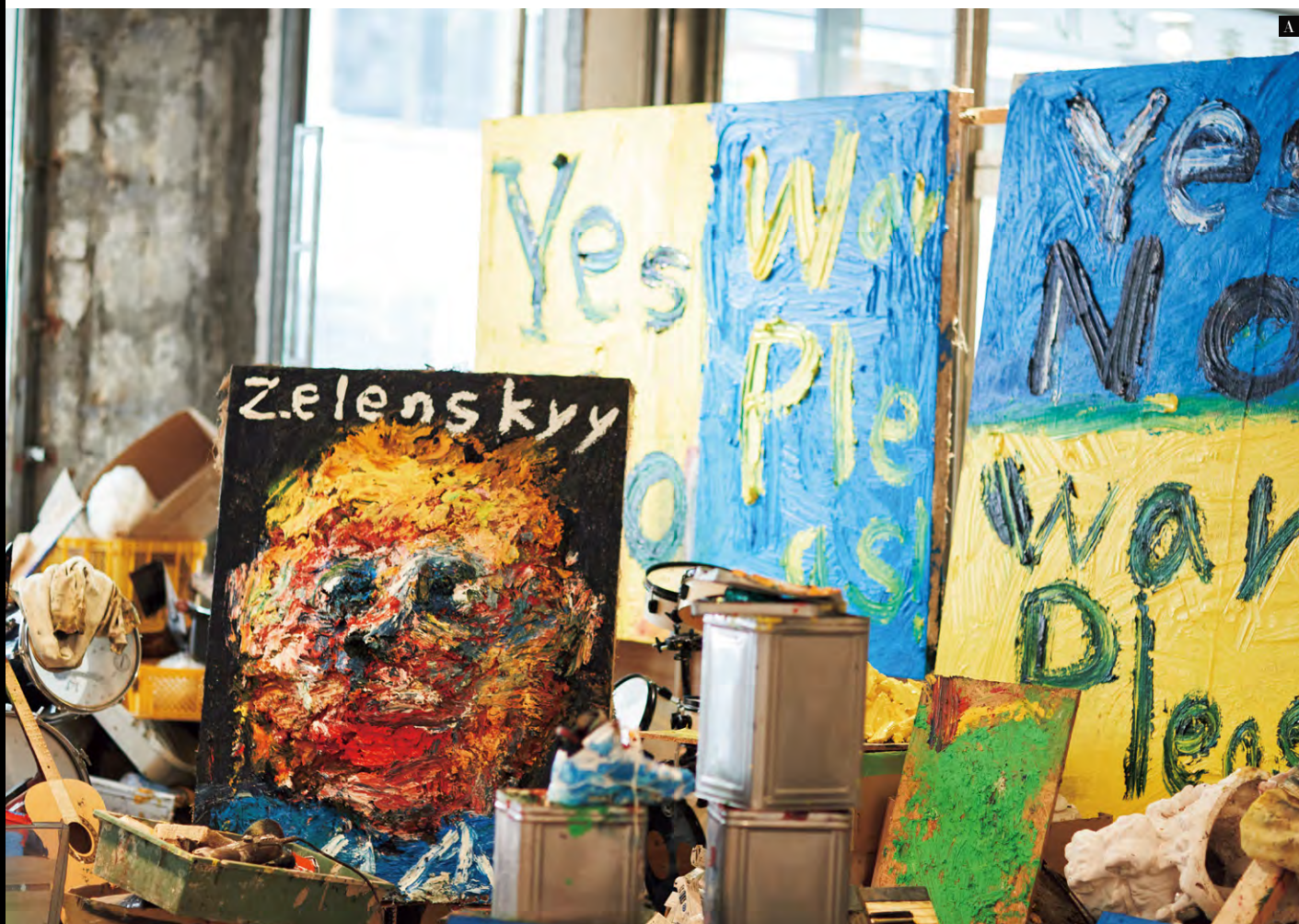
text : Monami Tsukada composition : Hiroyuki Horikawa